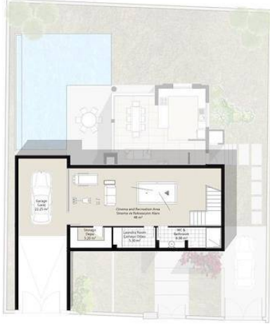
A TYPE - TIP BASEMENT PLAN BODRUM KAT PLANI AREA - ALAN: 110.73 m 2