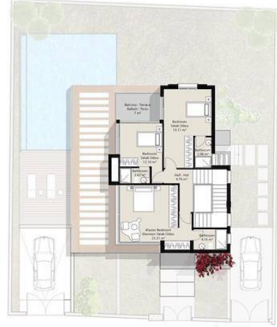
A TYPE - TIP FIRST FLOOR PLAN BİRİNCİ KAT PLANI AREA - ALAN: 111.5 m 2