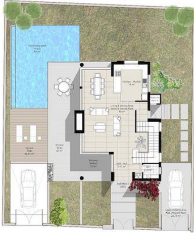
A TYPE - TIP GROUND FLOOR PLAN ZEMİN KAT PLANI AREA - ALAN: 112.2 m 2

Daha fazla bilgi için profesyonel emlak danışmanınızı arayınız.