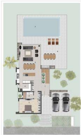
ZEMİN KAT PLANI