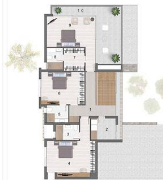
BİRİNCİ KAT PLANI