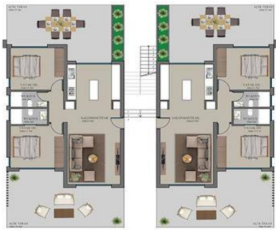
TİP A ZEMİN KAT PLANI BRÜT ALAN:234.5M2