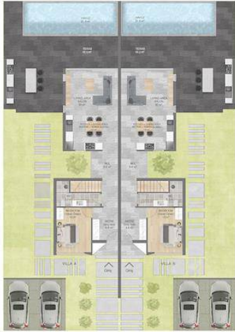
ZEMİN KAT A A= 78 m²