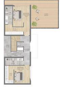
1. KAT PLANI A= 80 m²