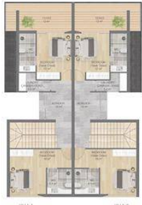
1. KAT A A= 69 m²