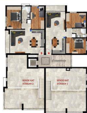
BİRİNCİ KAT PLANI

Daha fazla bilgi için profesyonel emlak danışmanınızı arayınız.