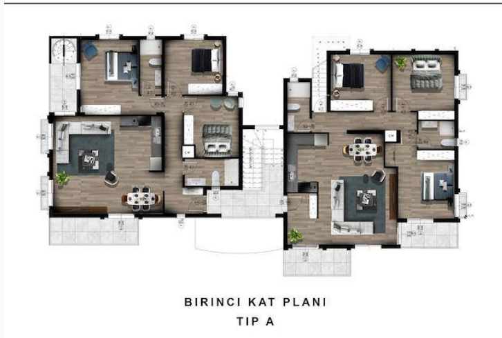
BİRİNCİ KAT PLANI TIP A