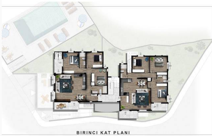
BİRİNCİ KAT PLANI TIP B