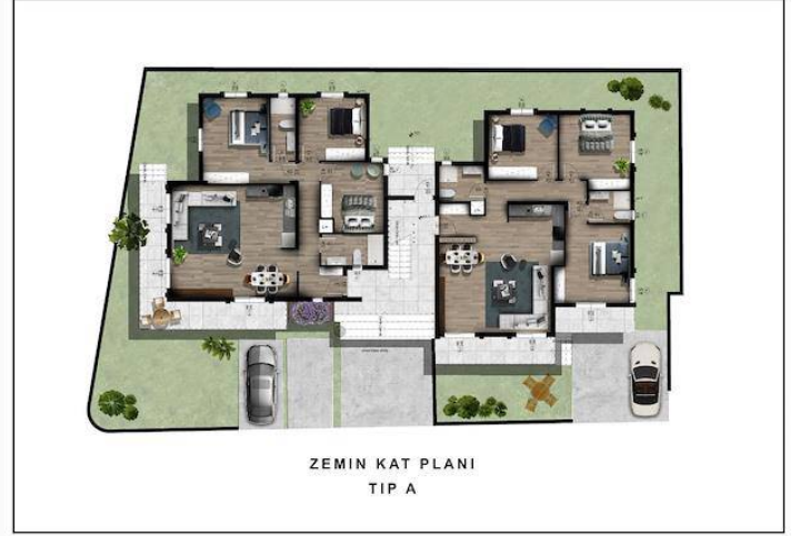
ZEMİN KAT PLANI TIP A